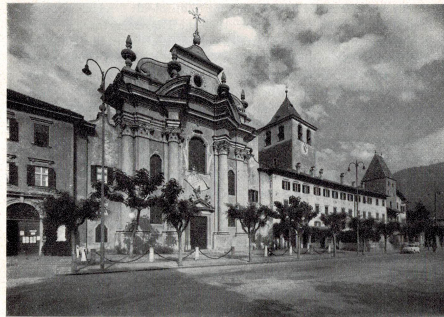
Die Klosterburg zu Gries. Die alte Burganlage wird von den Stiftsgebäuden wie von einem Mantel umhüllt. Der mächtige Bergfrit dient als Glockenturm, der alte Torturm birgt die Abtskapelle. Rechts von der Kirche befindet sich der Eingang ins Kloster, links der Eingang zum Pfarramt.

Während bis vor einigen Jahrzehnten die Bevölkerung von Gries zum Großteil dem bäuerlichen Beruf (Obst- und Weinbau) nachging, ist heute die berufliche und soziale Schichtung sehr vielfältig. Viele, die in der Stadt selbst ihren Beruf ausüben bzw. ihrem Verdienst nachgehen, wohnen in der Peripherie. An all diesen sprachlich, bildungsmäßig und berufsmäßig verschiedenen Kategorien von Pfarr-